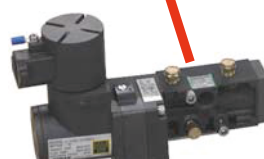
NAMUR規格小型防爆ソレノイドバルブ : d2G4 VEP(NO) / VEP(NC)