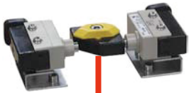
スイッチボックス : IP67 LBF