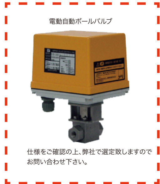
電動自動ボールバルブ