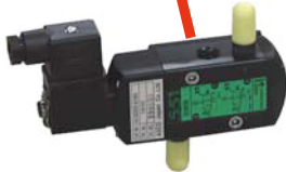
NAMUR規格ソレノイドバルブ : IP65 SV(NO) / SV(NC)